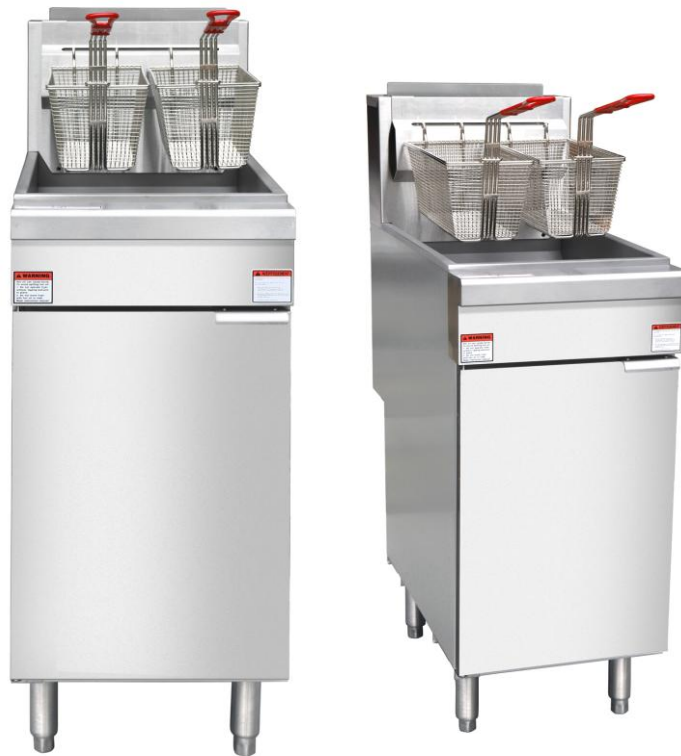
NFF4L / NFF4N