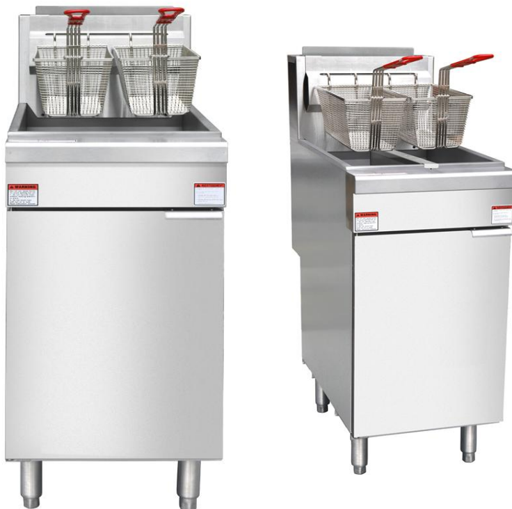
NFF5L / NFF5N